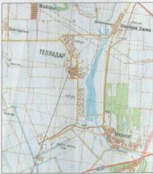
Місце розташування храму страстотерців кн. Бориса і Гліба УПЦ КП