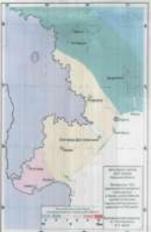
Одеська обл. Рес. 6.5 ДБН В.4.1-11:2014