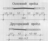
ПОПЕРЕЧНІ ПРОФІЛІ ПРОЇЗДІВ.

Проект виконано у відповідності з діючими нормами і правилами та вирішеною метою забезпеченості і захищеності при виконанні будівель.